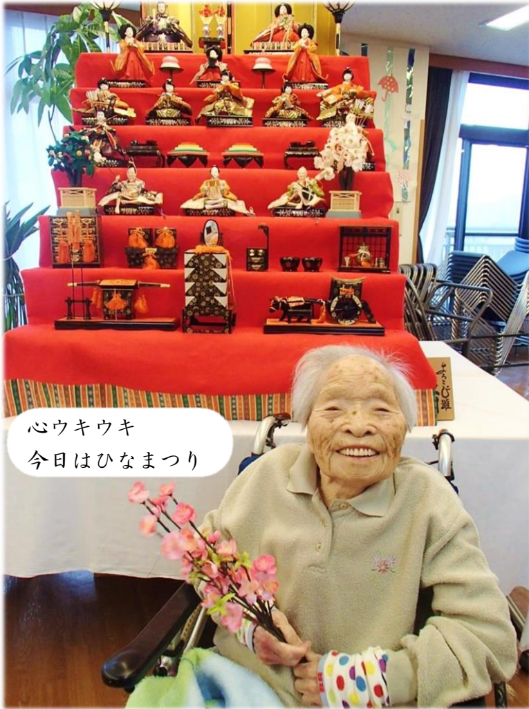
心ウキウキ 今日はひなまつり