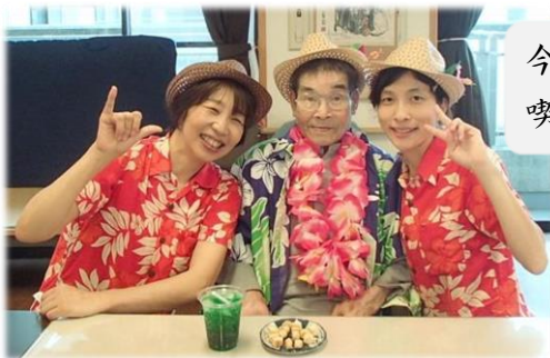
今日のおやつはクリームソーダ 喫茶店にも負けないよ